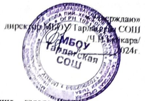
Схема маршрутизации детей и работников летних оздоровительных организаций отдыха детей в случае выявления у них острых неинфекционных заболеваний, переломах и при обострении хронических заболеваний